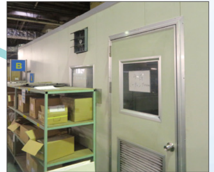
ミーティング室 事例