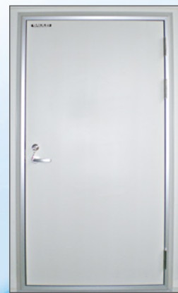
クリーンフィット ドア