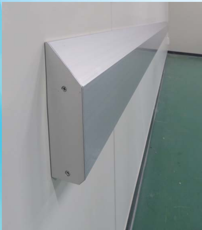
アルミ製台車ガード(端部塞ぎ材取り付け)

食品工場では、台車やカートが作業室内を頻繁に行き交うため、内装材と衝突し、壁パネルが破損してしまうリスクが常に存在します。当社のアルミ製台車ガードは、大きな出代(45mm)と、幅広い台車接触面(100mm)が特長の強固な構造。衝撃や衝突による壁パネルの破損防止に効果を発揮します。