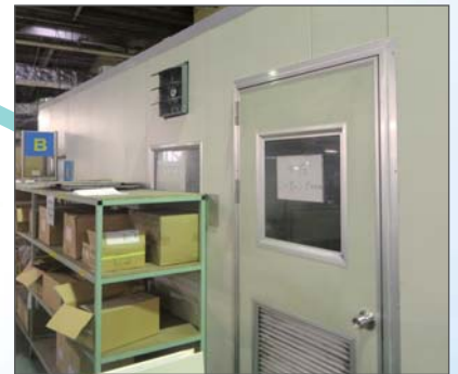
ミーティング室 事例