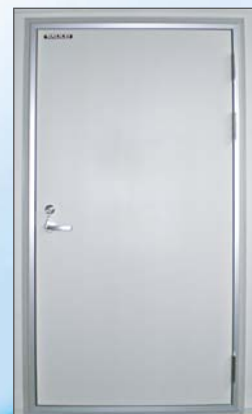
クリーンフィット ドア